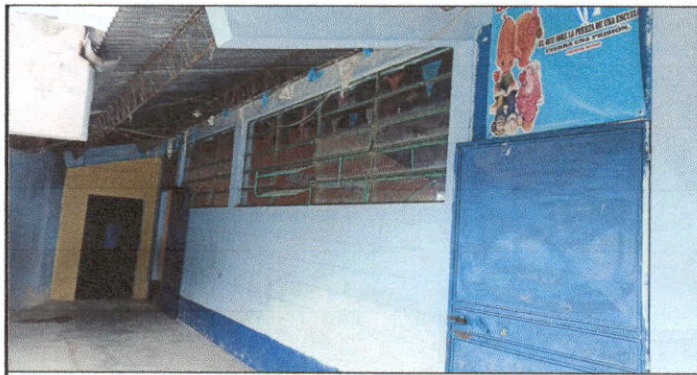
Foto 5: mantenimiento de estructura de metal del techo del módulo de 2 aulas donde será sustituida la lámina.