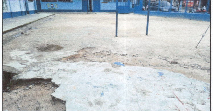
Foto 2: Sustitución de piso de torta de concreto deteriorado por el paso del tiempo.