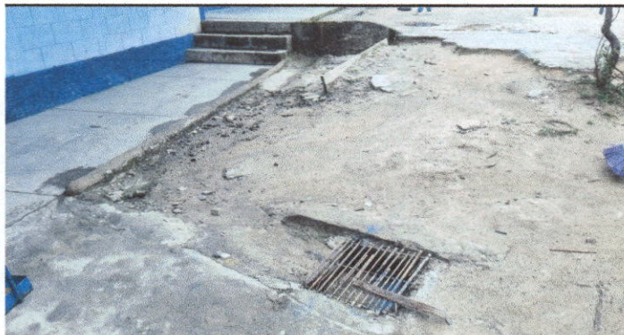
Foto 3: sustitución de caja No. 1 de registro, incluye sustitución de tubos de 6 pulgadas.