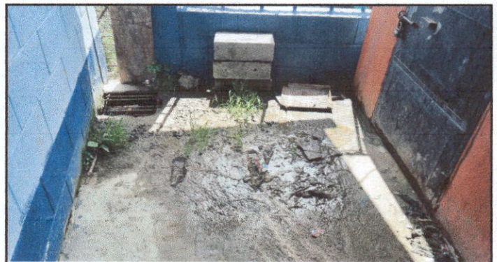
Foto 4: sustitución de caja No. 2 de registro, que incluye sustitución de tubos de 6 pulgadas.